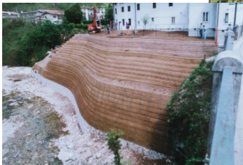
Situazione a costruzione ultimata